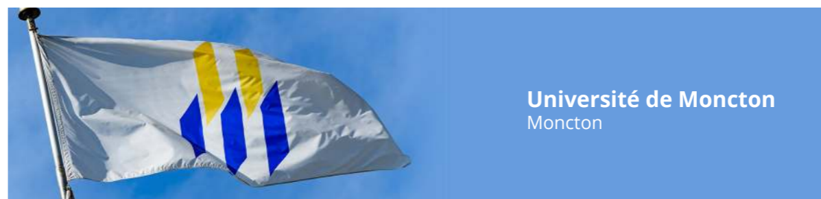
Université de Moncton Moncton